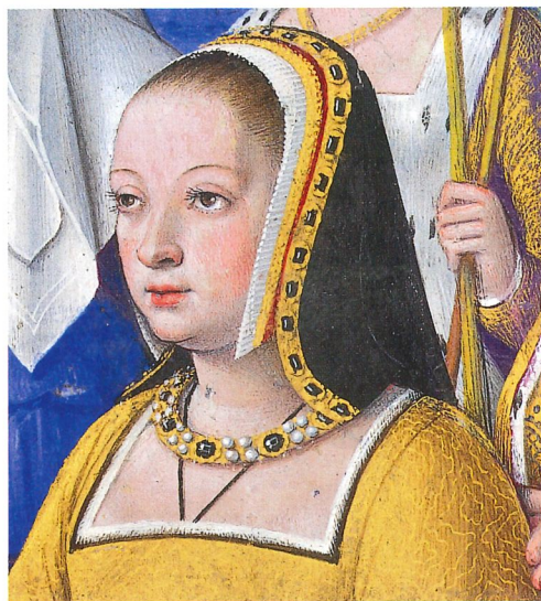
Détail d'une enluminure représentant Anne de Bretagne, début du XVI e siècle (Bibliothèque nationale de France, Paris).

Héritière du duché de Bretagne, Anne épouse, à 13 ans, Maximilien d'Autriche, l'héritier du Saint Empire romain germanique. Le roi de France, Charles VIII, envahit la Bretagne et fait annuler le mariage. Pour retrouver la paix, Anne, âgée de 14 ans, épouse Charles VIII et devient reine de France. Le roi de France récupère ainsi la Bretagne.