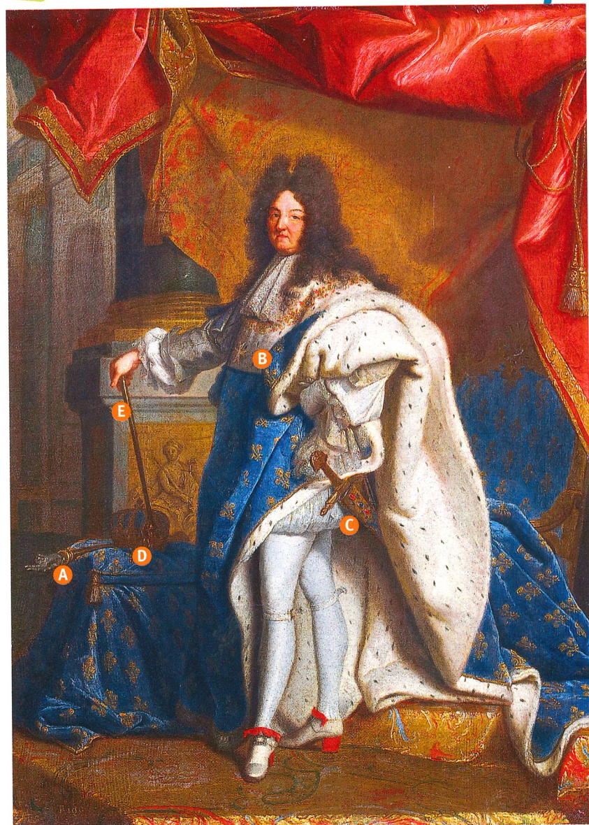
Peinture de Hyacinthe Rigaud, Louis XIV en costume de sacre , 1701, hauteur 2,77 m, largeur 1,94 m (musée du Louvre, Paris).