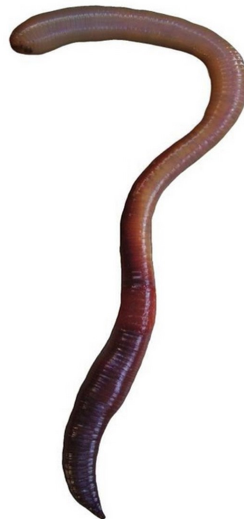
VER DE TERRE